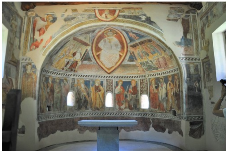
Affreschi della Cappella di San Salvatore

La chiesa potrà essere visitata grazie ad una app scaricabile sul telefonino. Parte del ciclo pittorico coevo alla chiesa risale al XII secolo. Arte sacra da riscoprire con le nuove tecnologie e il volontariato culturale