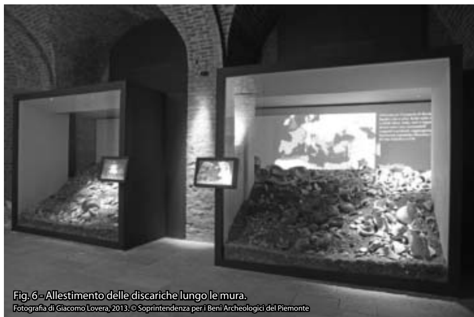
Fig. 6 - Allestimento delle discariche lungo le mura.