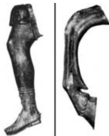
Fig. 5 - Frammenti bronzei di un monumento equestre romano rinvenuti nel XVI secolo durante la costruzione della chiesa dei SS. Martiri in via Garibaldi.

I lati della nicchia ospitano delle epigrafi clipeate (a scudo), in genere utilizzate sulle basi di monumenti equestri ma in questo caso non direttamente collegabili ai vicini reperti bronzei.