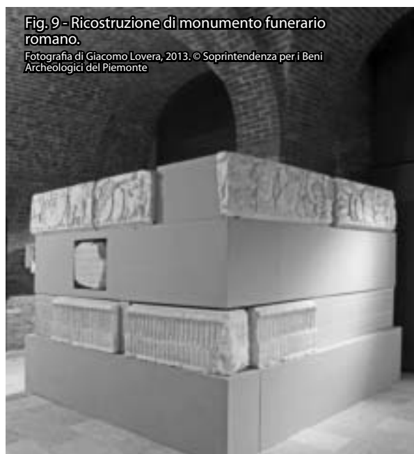
Fig. 9 - Ricostruzione di monumento funerario romano.