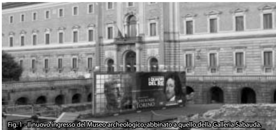
Fig. 1 - Il nuovo ingresso del Museo archeologico, abbinato a quello della Galleria Sabauda.