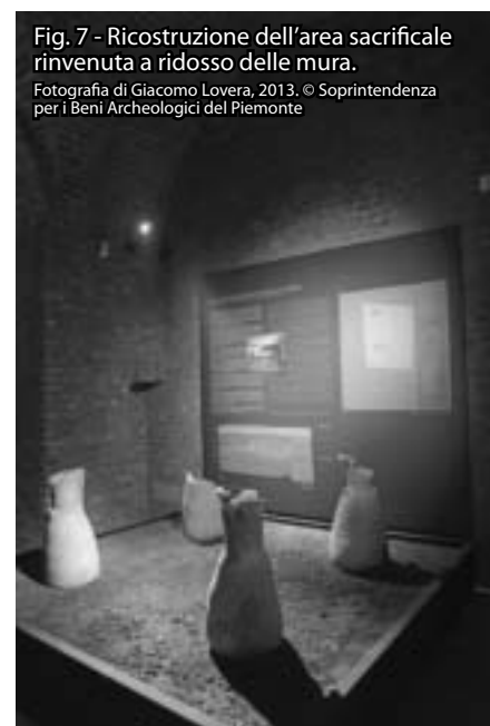
Fig. 7 - Ricostruzione dell'area sacrificale rinvenuta a ridosso delle mura.