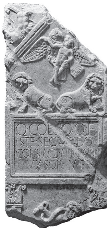
Fig. 2 - Epigrafe rinvenuta nel 2011 durante uno scavo archeologico d'emergenza in corso Palermo, quasi all'angolo con via Ancona.

omogenee. Passando da una stanza all'altra, con qualche "salto", si può realizzare un cammino che conduce dalla preistoria ai secoli del tardo Rinascimento, passando per l'epoca romana, la prime fasi della cristianizzazione, le invasioni barbariche, l'alto medioevo, il medioevo pieno; comunque, come si è detto, le varie stanze contengono materiale omogeneo e sono "autoconclusive", dunque si può tranquillamente passare da una all'altra senza preoccuparsi di seguire necessariamente una linea temporale.