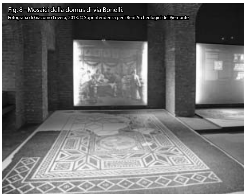
Fig. 8 - Mosaici della domus di via Bonelli.

Fotografia di Giacomo Lovera, 2013. © Soprintendenza per i Beni Archeologici del Piemonte