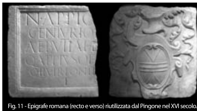
Fig. 11 - Epigrafe romana (recto e verso) riutilizzata dal Pingone nel XVI secolo.

Davvero interessante è la lapide romana (fine I sec. d.C.) che nel XVI secolo si trovava riutilizzata nella cripta della chiesa della Consolata: venne rimossa nel 1568 dal già citato Pingone che, sul lato non lavorato, vi fece scolpire il proprio stemma nobiliare da affiggere sull'ingresso della