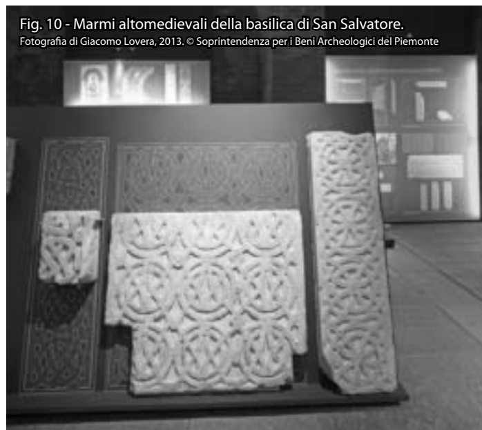
Fig. 10 - Marmi altomedievali della basilica di San Salvatore.

Grazie a un puntuale raffronto con le miniature conservate presso l'Archivio Capitolare di Vercelli, un altro pannello ci ricorda inoltre che le decorazioni marmoree romaniche, giunte sino a noi in una veste candidamente monocroma,