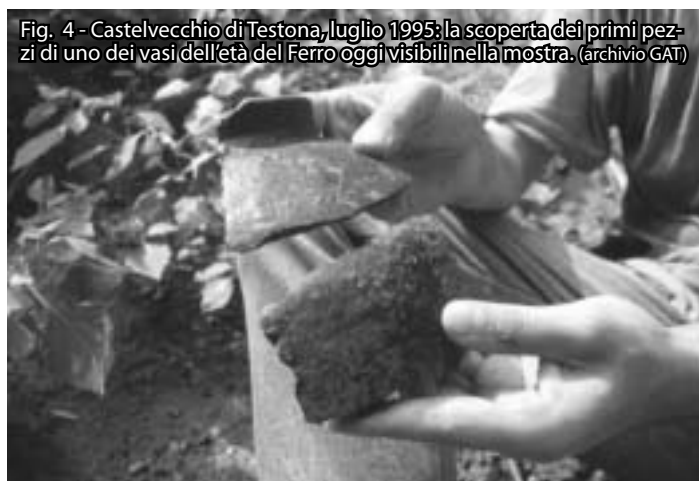
Fig. 4 - Castelvechchio di Testona, luglio 1995: la scoperta dei primi pezzi di uno dei vasi dell'età del Ferro oggi visibili nella mostra.

La quantità davvero impressionante di materiale racchiuso in questa nuova, succulenta “fetta” di museo non è riasumibile in queste poche righe; comunque, giusto per stimolare la vostra curiosità, ve ne propongo una descrizione molto rapida, per sommi capi, come farebbe un qualunque visitatore che volesse invitare gli amici a vivere la sua medesima esperienza.